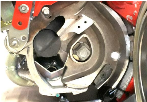
Trappe plus réactive, surélevée et rotative